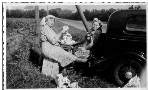
På søndagsudflugt med Forden. Kaffe i grøftekant

Det fik stor betydning for familien, at hun havde bil. Den bragte os rundt i landet til Himmelbjerget, Skagens Gren o.s.v.