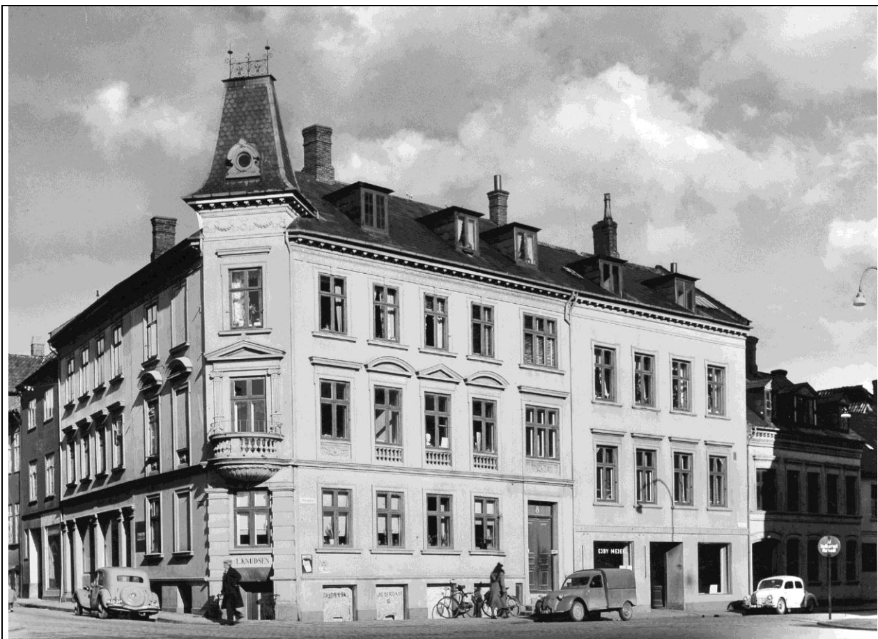
Albanitorv 8. Indgang til klinikken mellem de to biler. Klinikken til højre.

Hun havde en trofast kundekreds og klinikken lukkede først, da bygningen blev revet ned i forbindelse med fornyelsen (ødelæggelsen) af Odense bymidte og bygningen af den underjordiske garage på Albani Torv.