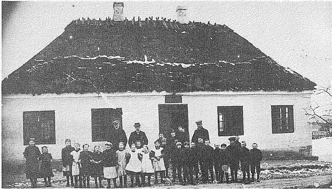
Rytterskolen i Broby hvor børn fra Næsby gik i skole gennem 200 år.